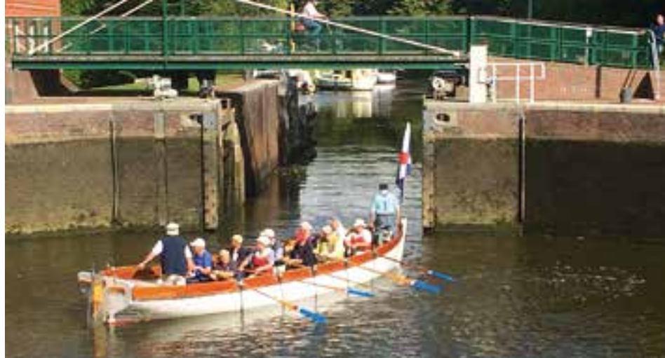
In der Kesselschleuse

Schutzhelme. So können wir gleich zum großen Kran durchfahren. Nach der Wasserung ruxen wir zum alten Binnenhafen. Wir unterqueren drei hintereinanderliegende tiefe Brücken. Über die Eisenbahnbrücke fährt gerade ein Güterzug - voll beladen mit VW-Autos. Eine sogenannte