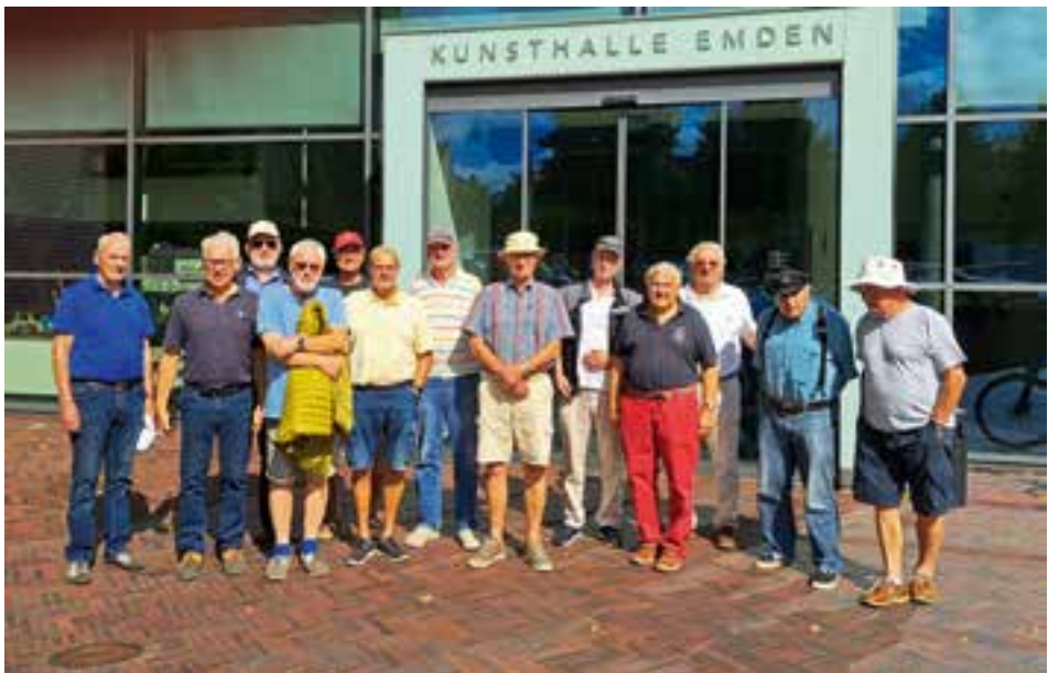
Henry Nannen Museum

Der Tag beginnt wieder gut. Nach dem Frühstück besucht uns eine Journalistin von der Emdener Zeitung für ein Interview. Um 10 Uhr sitzen wir wieder im Kutter. Es geht wieder zur Kesselschleuse. Die Journalistin ist mit dem Rad vorausgefahren. Sie macht einige Fotos von uns. Den Kessel verlassen wir diesmal nach Südosten. Wir passieren das schöne Freibad und die Jugendherberge, welche in den Grünanlagen liegen. Der Kanal Fehntjer Tief führt uns südwärts an schönen Häusern und gepflegten Gärten vorbei. An allen Kanälen sehen wir viele Jachtclubs. An einem Waldufer legen wir an und machen eine Picknickpause. Schließlich kommen wir an die Borssumer Schleuse. Wir sind jetzt wieder im großen Vorhafen, wo auch die Nordseewerke etabliert sind. Wir rudern wie am ersten Tag zum Alten Binnenhafen. Bei der Eisenbahnbrücke müssen wir erst 2 Flusskreuzfahrtschiffe passieren lassen. Beim Feuerschiff legen wir wieder an und