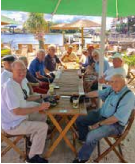
Strandbar Karibik Feeling

gehen zum ‚Dat Otto Hus‘. In der Innenstadt zeigen einige Fußgängerampeln bei den roten bzw. grünem Männchen die Figur von Otto in seiner typischen Haltung. Nach einem Schlenker zur Strandbar verholen wir den Kutter Richtung Hotel. Zum Abendessen rudern wir wieder auf die andere Seite des Delfts und speisen im italienischen Restaurant ‚Castos‘. Unser Tisch steht direkt am Ufer. Wieder treffen wir unsere Freunde von der Werft. Nebenam am Delft Strand ist heute Livemusik. Wir gehen rüber und kommen mit vielen Gästen ins Gespräch. Später müssen wir nur noch rüber ans Ostufer. Der Himmel ist immer noch strahlend dunkelblau. Der Mond zeigt seine Sichel (zunehmend). Es ist kühl geworden.