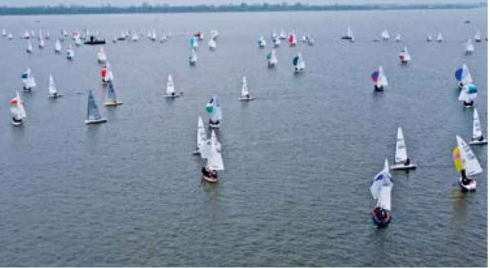
Die Letzten Helden mit über 150 Meldungen